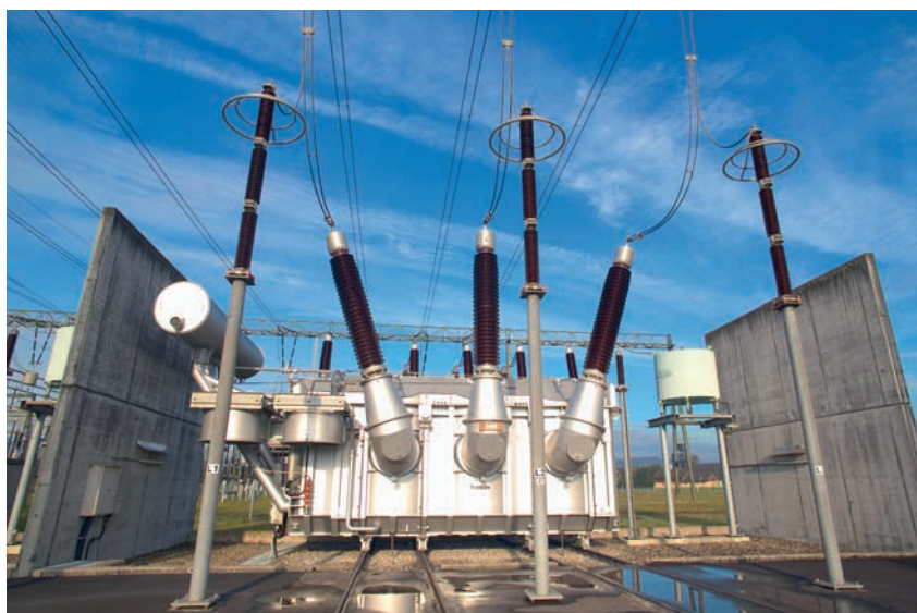
CKW ist der Strom-Netzbetreiber für das Gemeindegebiet Meggen. Im Bild das CKW-Unterwerk Mettlen.

Gleichzeitig mit Inkrafttreten des Reglements wird der Gemeinderat mit CKW