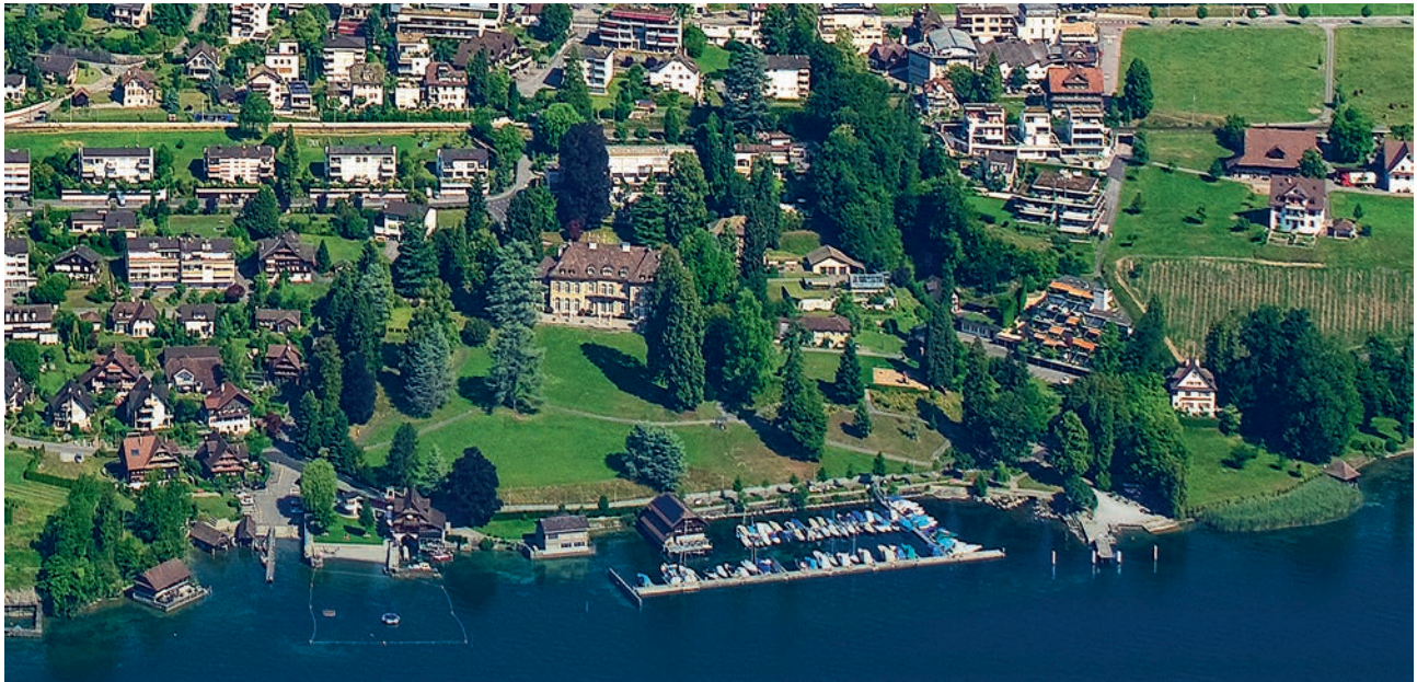
Die Luftaufnahme zeigt die Seestrasse mit der näheren Umgebung. Über die aktuellen Projekte in diesem Bereich informierte ein Artikel in der Juli-Ausgabe der Gmeindsposcht.