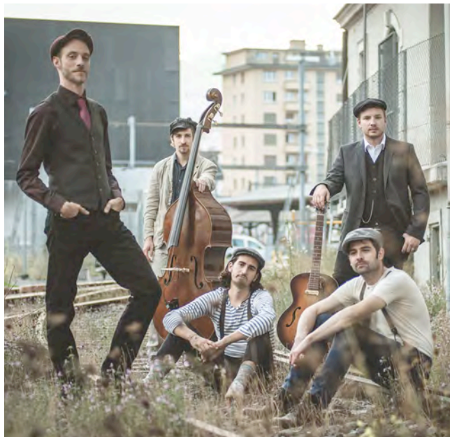
Belmondos Tanzkapelle gehört zu den sechs Formationen, welche für «Musig am See 2020» gebucht waren.

Weitere Informationen auf der Website: www.musig-am-see.ch