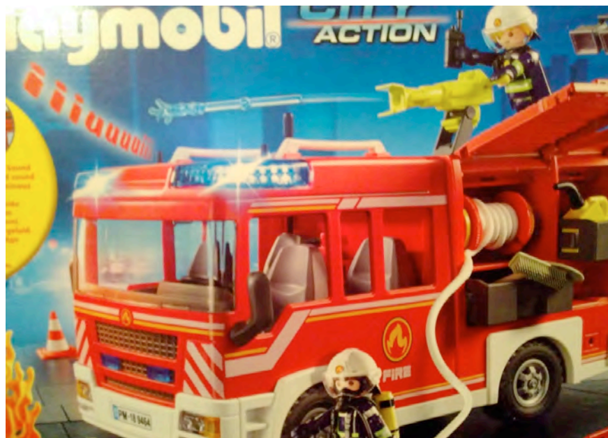
Neu im Playmobil-Sortiment: Cooles Löschfahrzeug

Sobald die Ludothek wieder wie gewohnt am Samstagvormittag und Dienstagnachmittag im EG des Gemeindehauses öffnen darf,