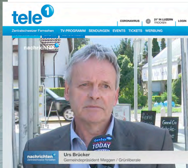
In der Newssendung von Tele1 vom Freitag, 17. April 2020 sah dies dann so aus.