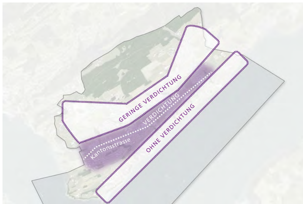
Potenziale zur Innenentwicklung für die einzelnen Quartiere von Meggen.

Basierend auf statistischen Daten wie Einwohner- und Wohnungsdichte, Wohnungsbelegung, Wohnflächen der kantonalen Dienststelle Raum und Wirtschaft (rawi) wurden die quantitativen Potenziale zur Innenentwicklung für die einzelnen Quartiere von Meggen ermittelt (Quartieranalyse, siehe nachfolgende Grafik).