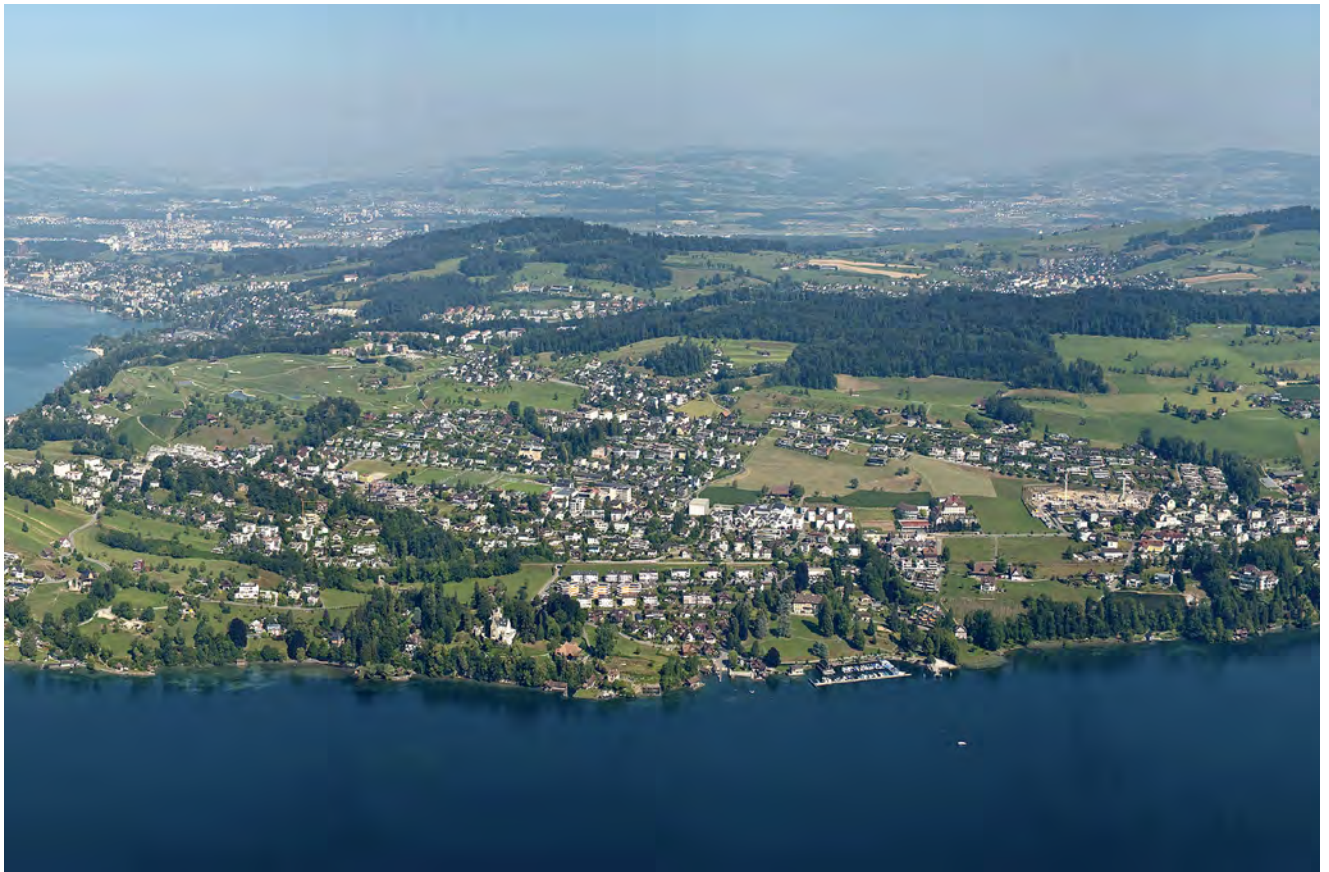
Aktuelle Flugaufnahme der Gemeinde Meggen (Ausschnitt aus dem grossformatigen Wandbild im EG des Gemeindehauses).