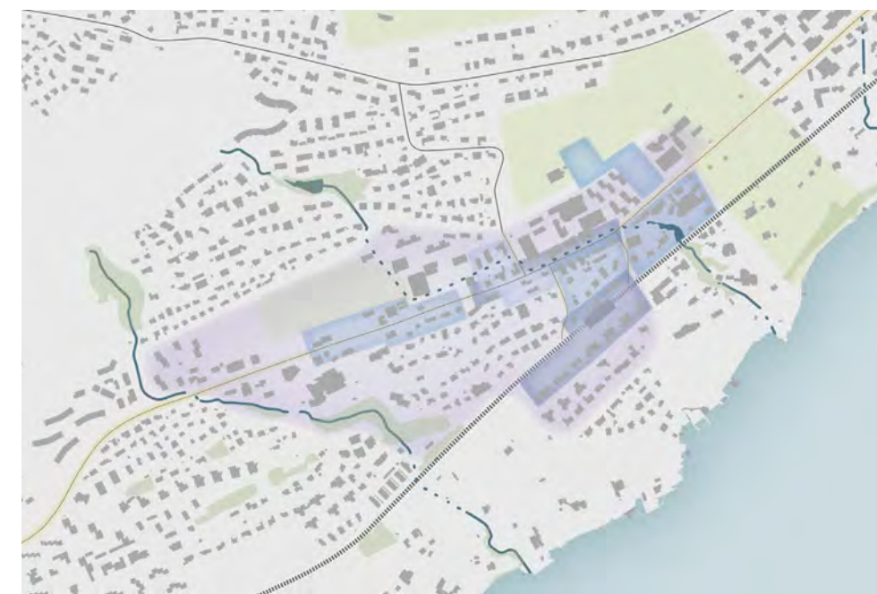
Masterplan Meggen Zentrum gemäss dem gleichnamigen Flyer.