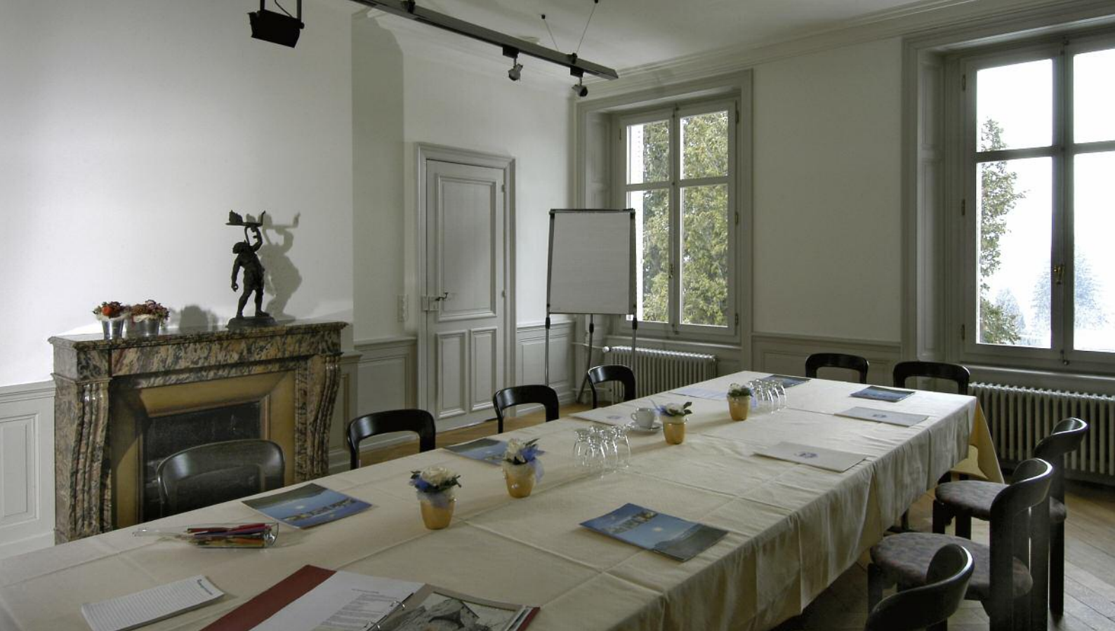
Der Seminarraum 1 im 2. Obergeschoss.