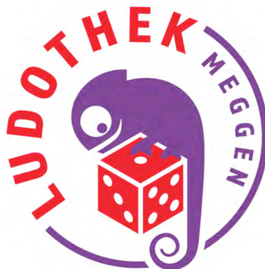
Das neue Logo der Ludothek Meggen.