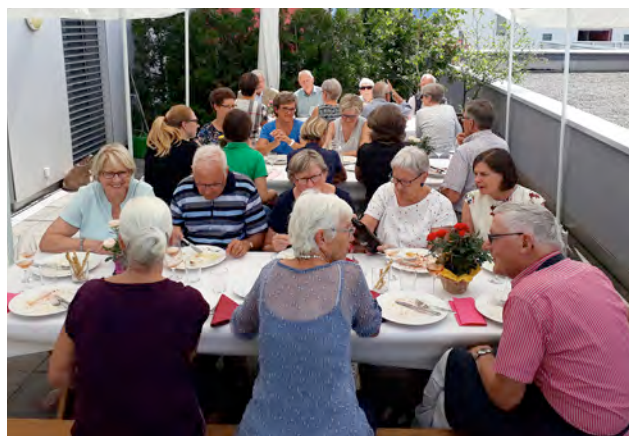
Das Jubiläum wird gefeiert.