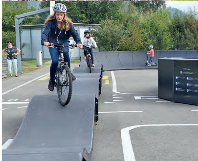
Megger 5-Kampf (oben) und Pumptrackanlage (unten): Zwei der Highlights am diesjährigen Megger Sporttag.

Neben dem sportlichen Einsatz und Ehrgeiz kommen am Megger Sporttag beim traditionellen Fünfkampf und an den Turnieren der Spass und die Freude am Spiel und am Miteinander nicht zu kurz.