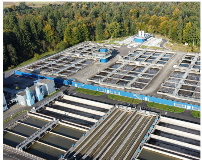
Die ARA Buholz in Emmen ist die grösste Abwasserreinigungsanlage der Zentralschweiz.

Weitere Informationen: real-luzern.ch/ara-event