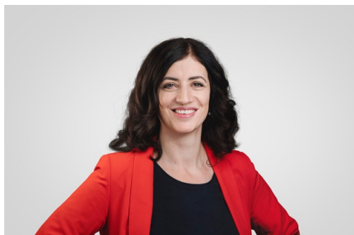
Regierungsrätin Ylfete Fanaj

Am 2. Juni ist die Luzerner SP-Regierungsrätin Ylfete Fanaj im Rahmen der Veranstaltungsreihe «Nah-bar» in Meggen zu Gast.