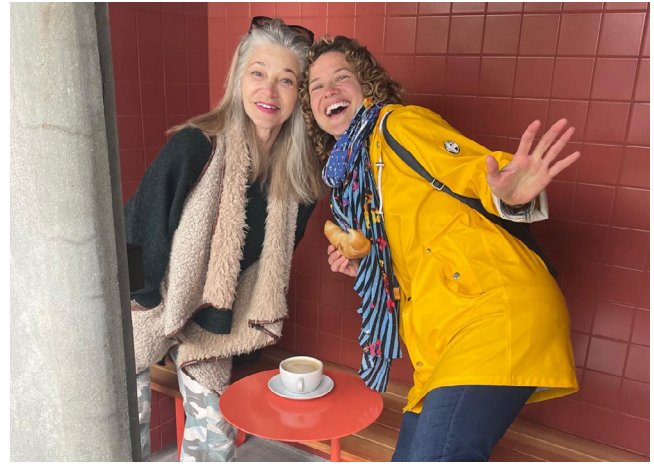
Kaffee und Gipfeli statt Glacé: Das kalte Wetter tat der Stimmung keinen Abbruch.