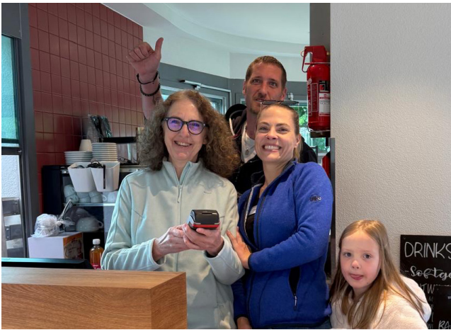
Das Badi-Team ist bereit für die Eröffnung.

Für Wärme sorgten Kafi Luz, Punsch und die fröhliche Atmosphäre vor Ort – und auch die Kinder kamen mit etwas Süßem auf ihre Kosten. Besonders mutig zeigten sich die Gäste, die trotz der kühlen Temperaturen den Sprung ins Wasser wagten.