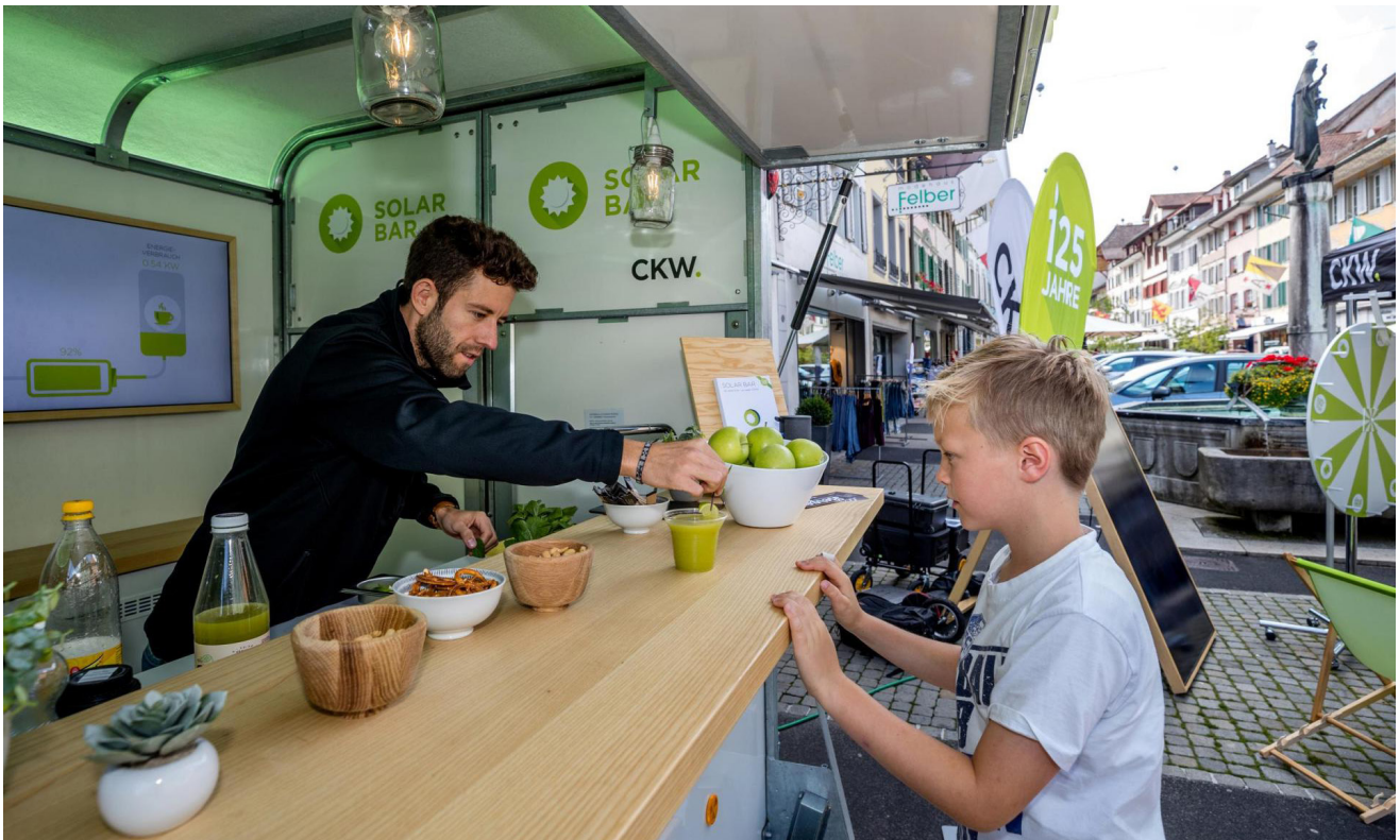
Die CKW Wärme-Bar macht am Samstag, 13. Juni 2026, auf dem Gemeindeplatz in Meggen halt.