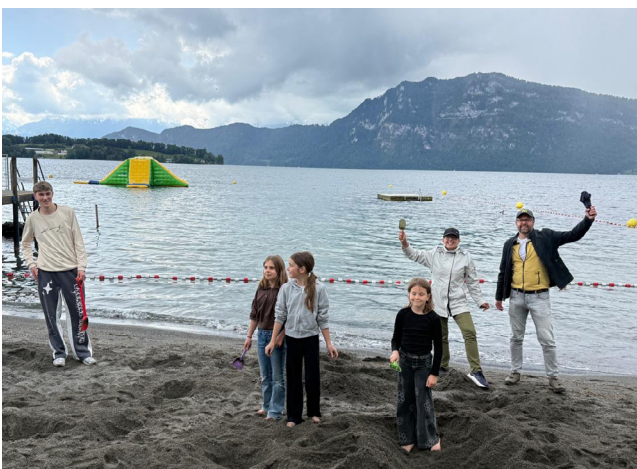
Voller Einsatz bei der Schatzsuche ...