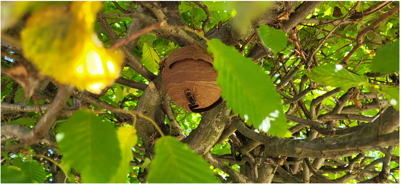
Primärnest der Asiatischen Hornisse