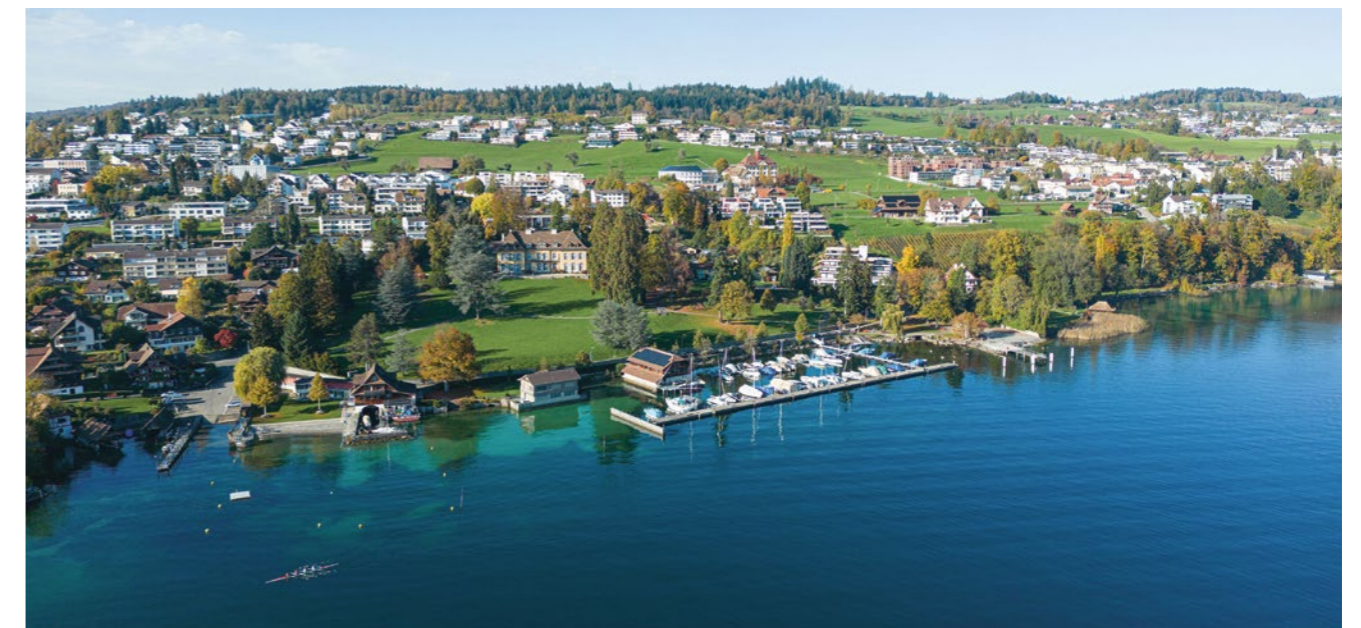
Meggen ist eine wohnliche, sympathische, attraktive und innovative Gemeinde und liegt idyllisch am See.