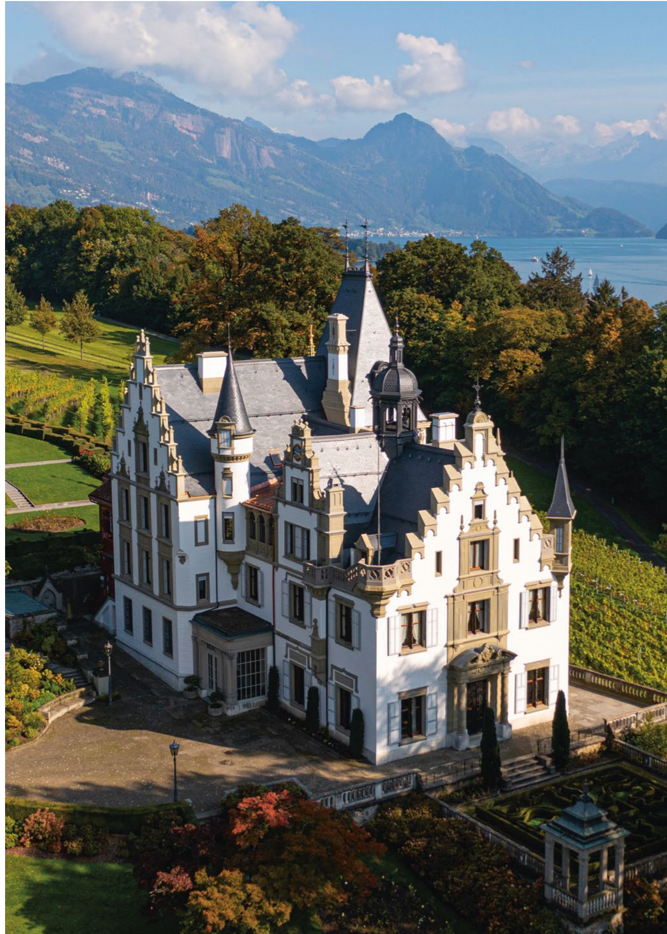
Das Dach von Schloss Meggenhorn strahlt nach der Sanierung im neuen Glanz.