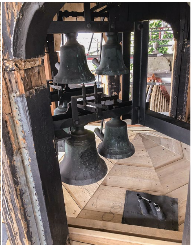
Dach Schloss Meggenhorn: Impressionen von den Sanierungsarbeiten.