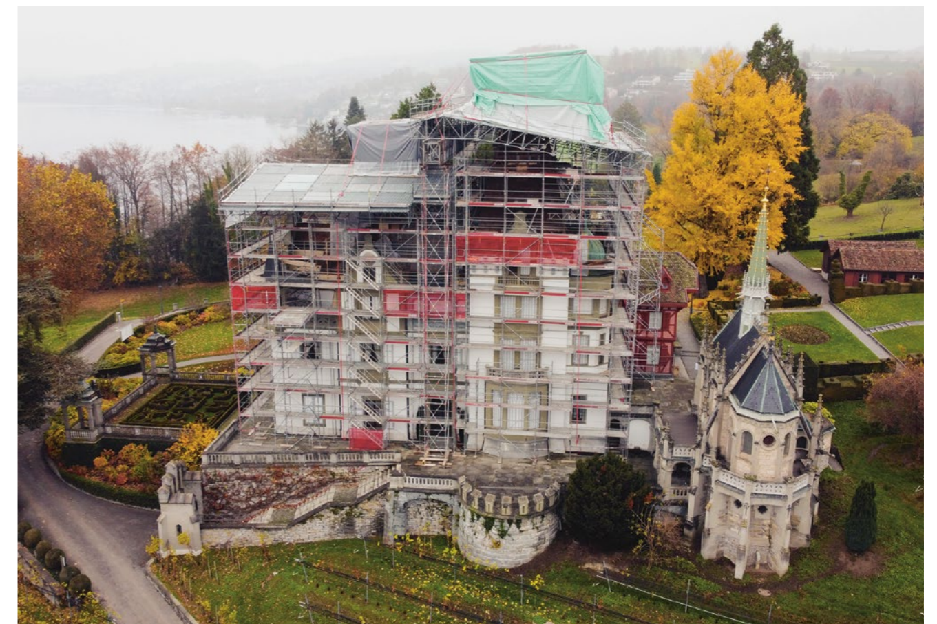
20. November 2021: Das Dach von Schloss Meggenhorn ist eingepackt.

Die Bleche und Ornamente stammen aus verschiedenen Bauzeiten und unterschiedlichen Materialien. Aufgrund einer Gesamtbeurteilung wurde in Zusammenarbeit mit der Denkmalpflege aus qualitativen Gründen entschieden, alle neuen Bleche in Kupfer auszuführen. Wo es der Zustand und der qualitative Unterschied zuliesse, blieben die alten Ornamente und Bleche erhalten. Gleichzeitig wurde mit der Dachsanierung die Schlossfassade kontrolliert und wo notwendig Schäden behoben. Ebenfalls wurden Sandsteinuntergründe retuschiert und Holzuntergründe neu gefasst.