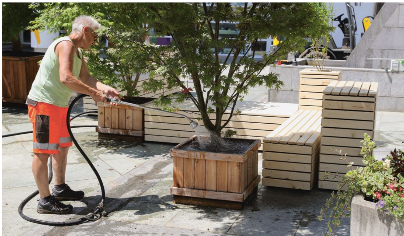
Dorfplatz: Auch im nächsten Sommer ist eine PopUp Piazza mit Sitzgelegenheiten und zusätzlichem Schatten geplant.

Liegenschaften des Finanzvermögens: Beim Bahnhofweg 2 werden bei Mieterwechseln die Küchen und Bäder aufgrund des Alters der Liegenschaft saniert. Beim Pfortnerhaus an der Habsburgstrasse 19 wird die Heizung ersetzt.